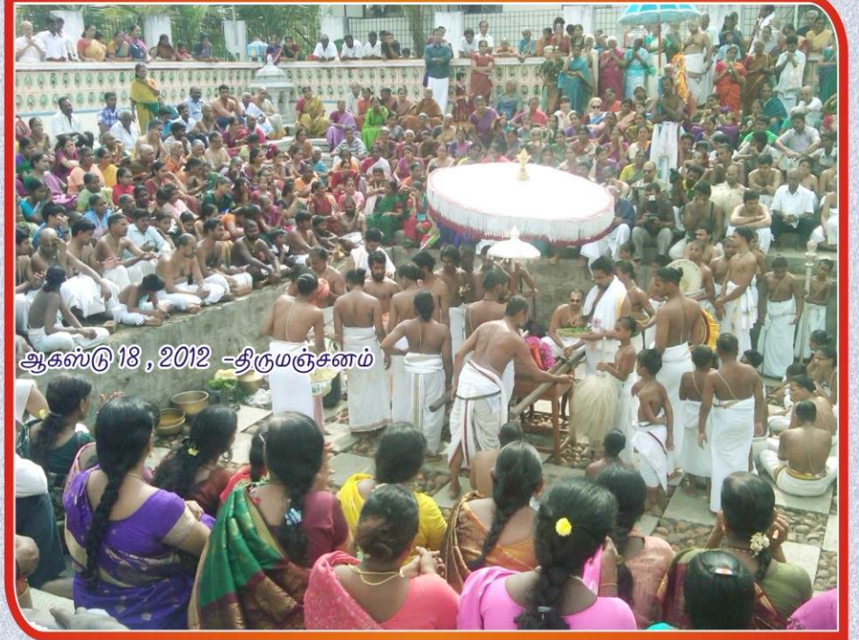
ஆகஸ்டு 18, 2012 - திருமஞ்சனம்