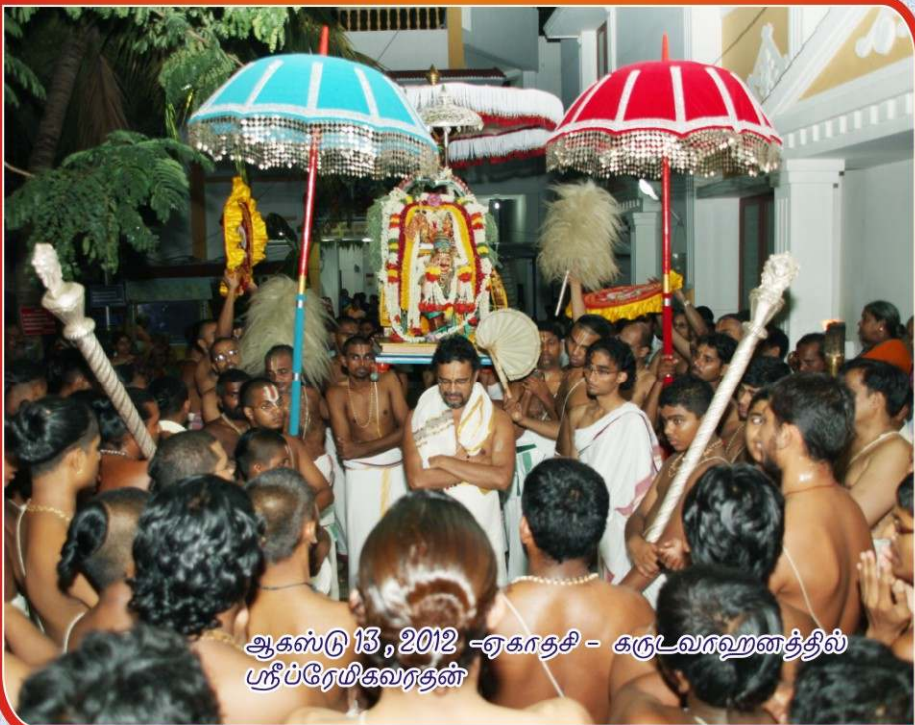
ஆகஸ்டு 13, 2012 - ஏகாதசி - கருடவரஹனத்தில் ஸ்ரீப்ரேயிகவரதன்