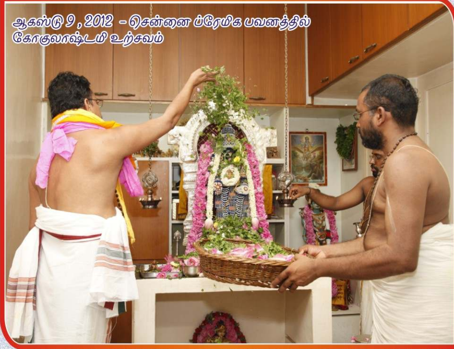
ஆகஸ்டு 9, 2012 - ஏசுன்னை ப்ரேயிக பவனத்தில் கோகுலாஷ்டயீ உற்சவம்