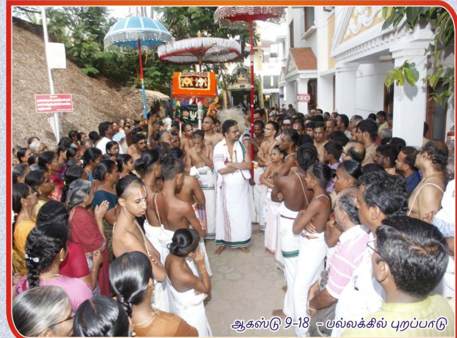
ஆகஸ்டு 9-18 - பல்லக்கில் புறப்பாடு