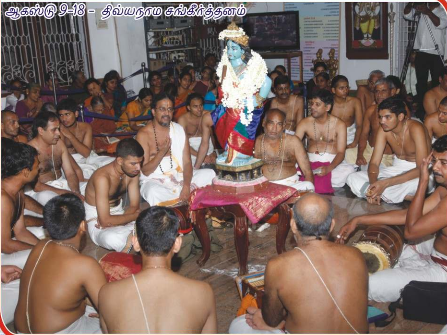
ஆகஸ்டு 9-18 - திவ்யநாம சங்கீர்த்தனம்