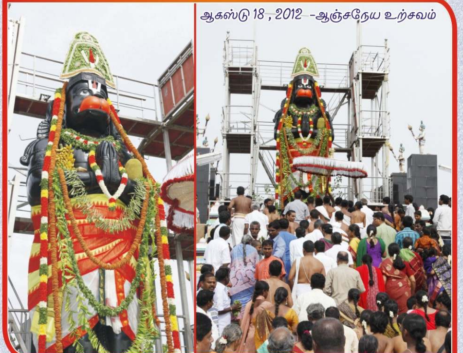
ஆகஸ்டு 18, 2012 - ஆஞ்சநேய உற்சவம்