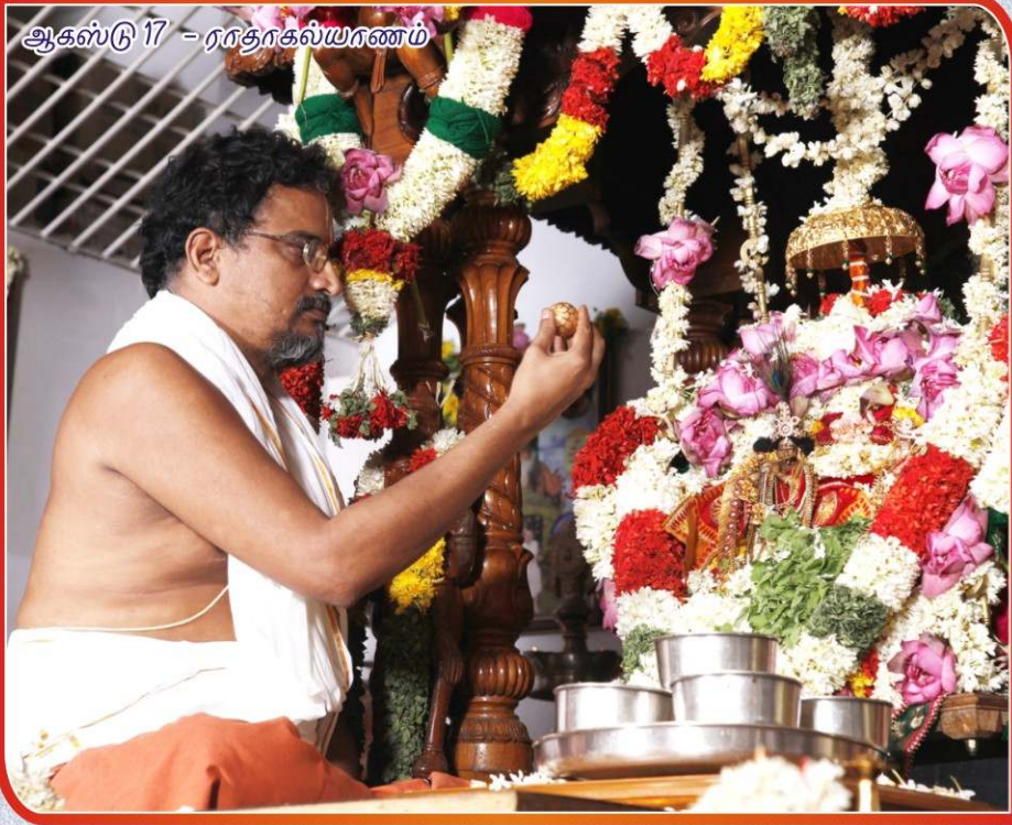
ஆகஸ்டு 17 - ராஜகல்யாணம்