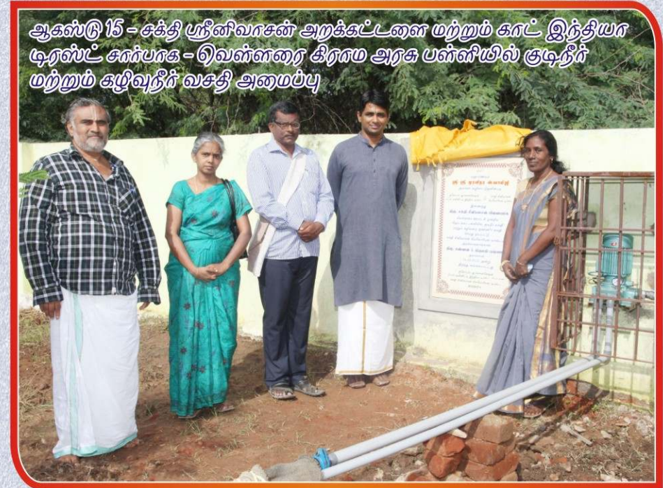
ஆகஸ்டு 15 - சக்தி ஸ்ரீனிவாசன் அறக்கட்டளை மற்றும் காட் இந்தியா டிரஸ்ட் சார்பாக - வெள்ளரை கிராம அரசு பள்ளியில் குடிநீர் மற்றும் கழிவுநீர் வசதி அமைப்பு